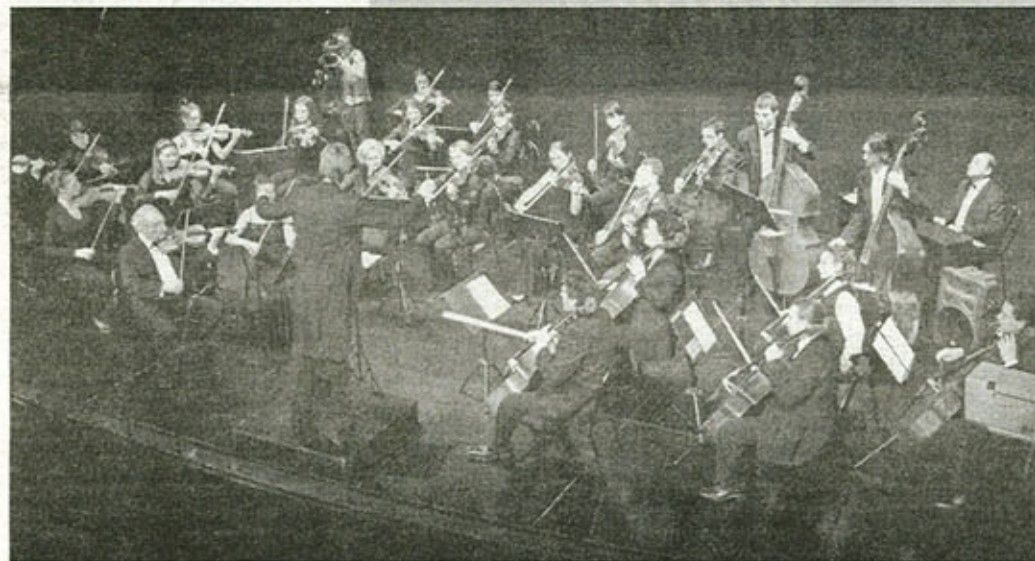
УЖИВАЊЕ У МУЗИЦИ: ЦРНОГОРСКИ СИМФОНИЈСКИ ОРКЕСТАР

Вјерујем да ће сваки наредни концерт Црногорског симфонијског оркестра бити корак даље, али увјек ће бити оних који ишчекују трешке и пребројавају празне столице у сали. И чаршија мора од нечега да живи